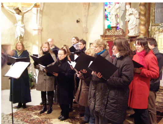
Schola Všech svatých Volyně