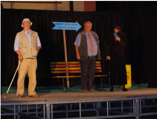
Podzim života je krásný