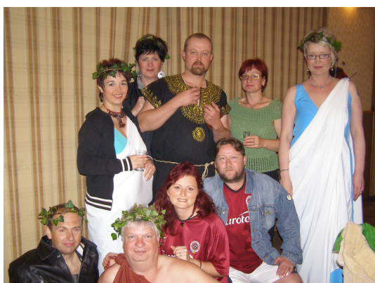
Jak začala a skončila Trojská válka