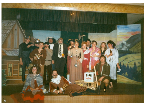
Nahořanská rebelie (1996)