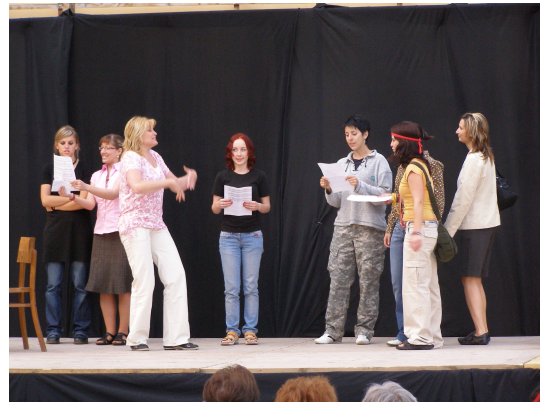
Muž sedmi sester