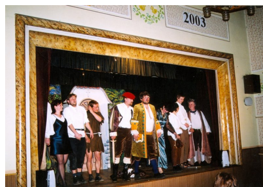
Loupežníci na Chlumu