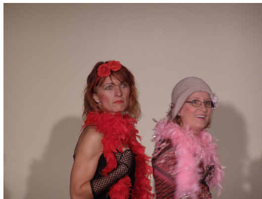
Holky ze Stoyerville