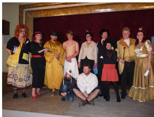
Čáry báby Cotkytle

Zatím naší zřejmě nejúspěšnější hrou je „Mátový nebo citron?“ se kterou sklízíme úspěchy již druhý rok.