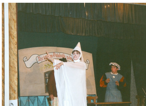
Zazděná paní (1998)